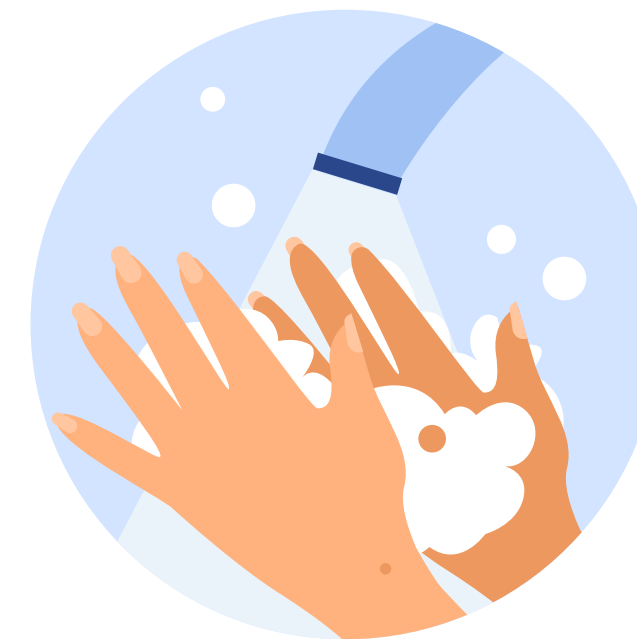
Миття рук з милом перед уроками

Керівник та засновник закладу освіти відповідає за те, щоб у медичному пункті були необхідні засоби та обладнання: безконтактні термометри, дезінфектори, антисептики для рук, засоби особистої гігієни та індивідуального захисту.