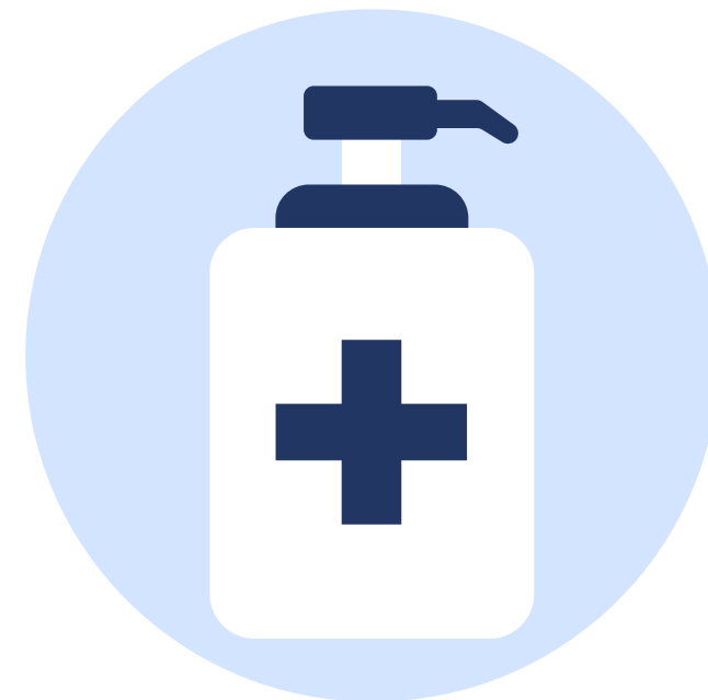
Дозатори для антисептиків